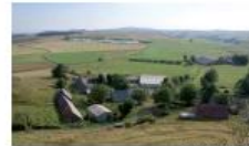
Stations de la Couze Pavin

Soyons précautionneux ! Que pouvons-nous faire pour prendre soin de l'eau ?