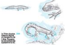
Le Triton des Alpes est une espèce protégée de la France. Il est présent dans le lac de Montcineyre.